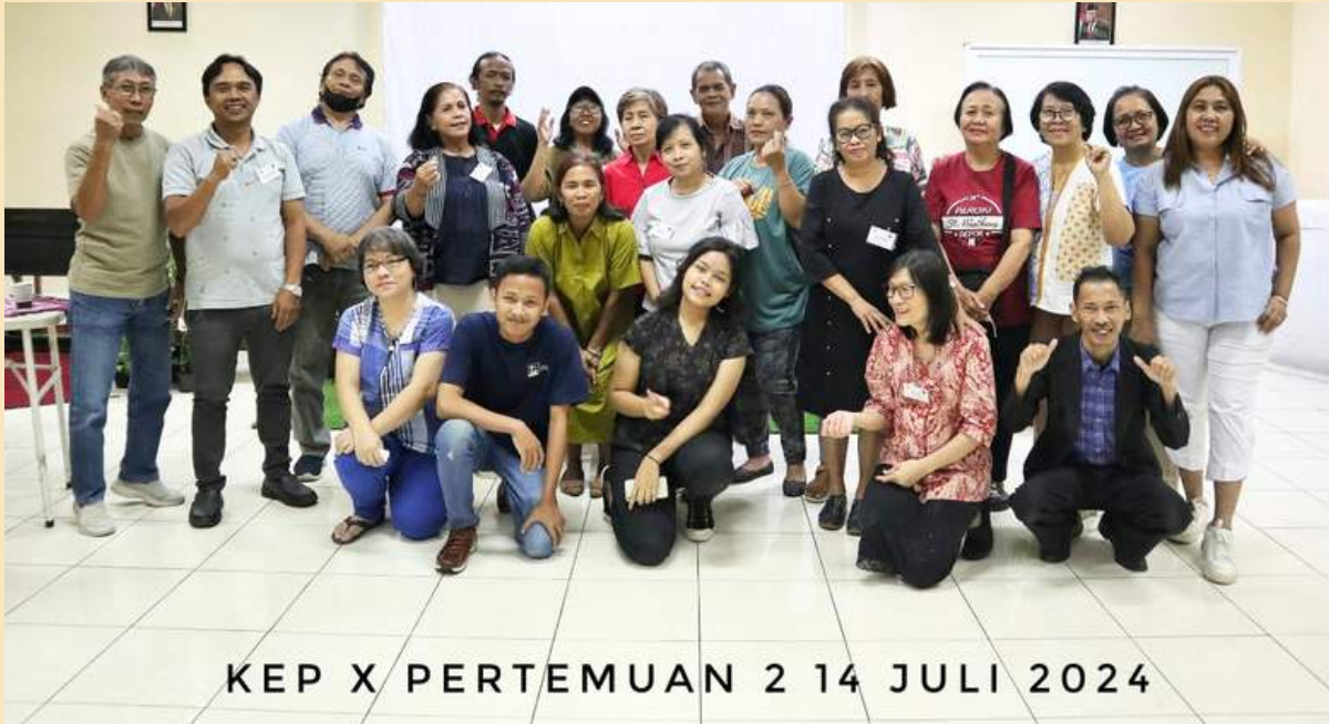
KEP X PERTEMUAN 2 14 JULI 2024