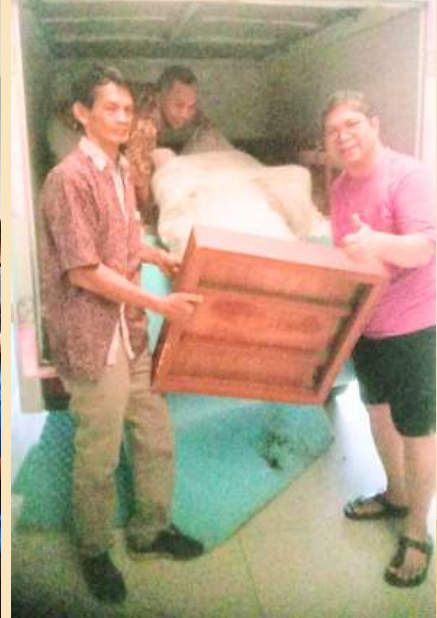
Mulai membongkar dan memindahkan patung Bunda Maria ke Paroki Santo Markus Depok