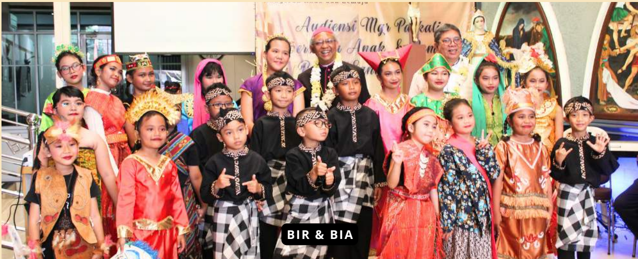
BIR & BIA