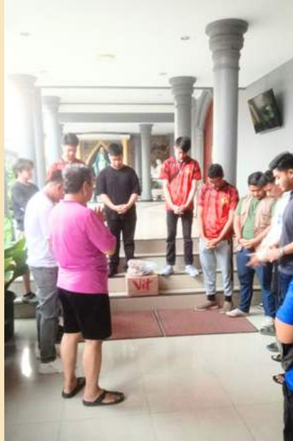
Berdoa dan dapat berkat dulu dari Romo sebelum membongkar