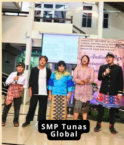
SMP Tunas Global