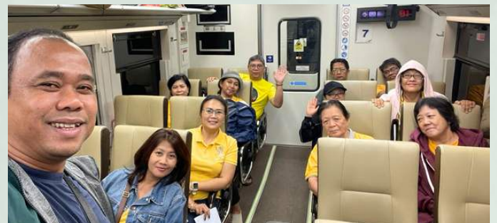
Kereta Senja Utama Ekonomi yang nyaman

( https://keluargakuduskap.or.id/profil/bidang/rumah-tangga-paroki-dan-pastoran/ )