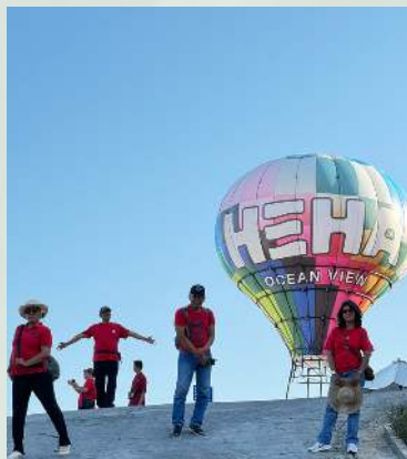
Rekreasi di Tebing Breksi & Heha Ocean View