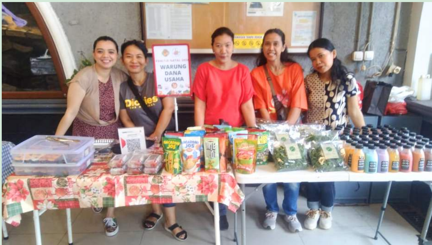
Warung Dana Usaha Panitia Natal 2024 yang dibuka setiap usai Misa Minggu Pagi.