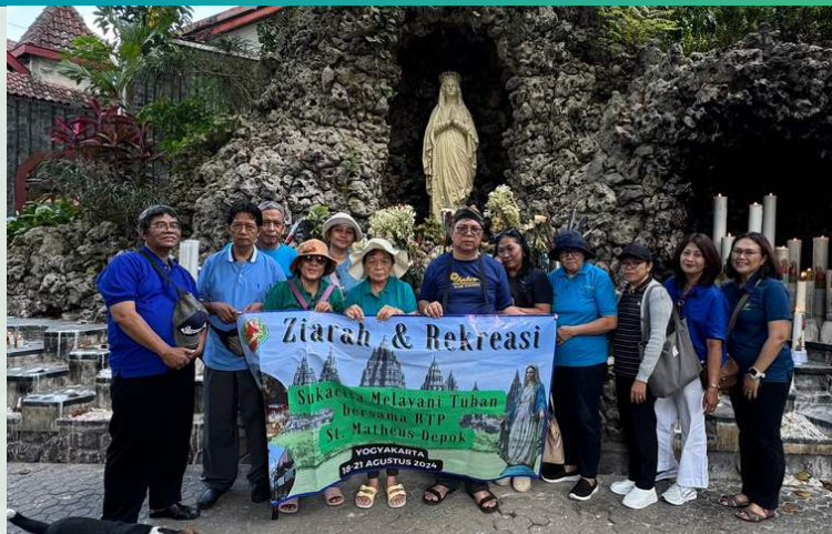
Doa & Jalan Salib di Gua Maria Sendangsono