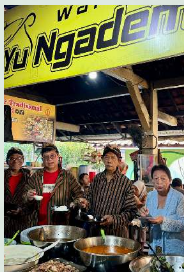
Kuliner Gudeg Krecek di Pasar Ngasem