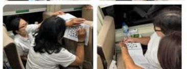
Berbagai Games & TTS memeriahkan suasana