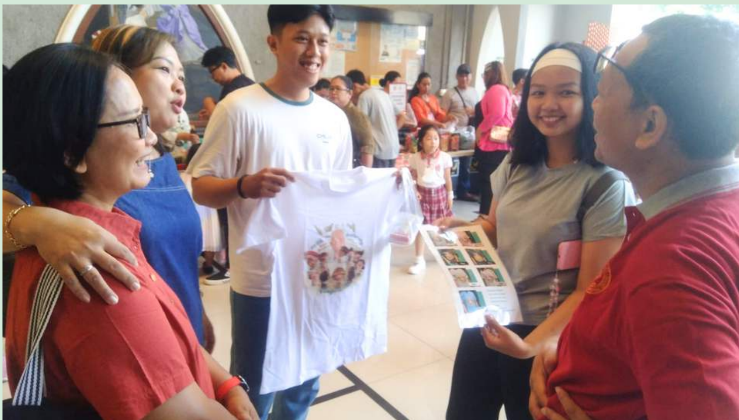
Sie Dana Orang Muda Katolik (OMK) menawarkan kaos bertema Paus Fransiscus. OMK menawarkan 2 jenis kaos, untuk anak-anak Rp 125.000 dan dewasa Rp 140.000 per kaosnya.