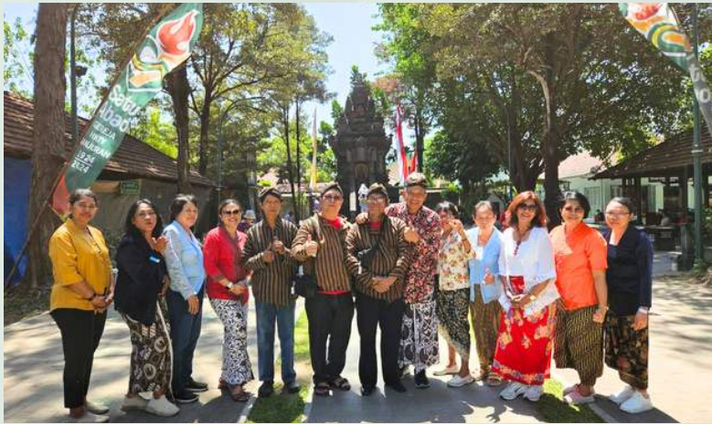
Ziarah ke Gereja Hati Kudus Ganjuran